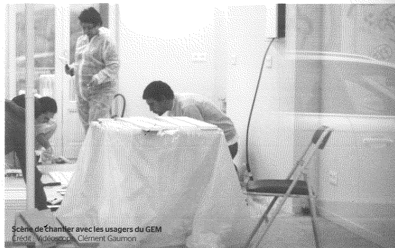
Scène de chantier avec les usagers du GEM