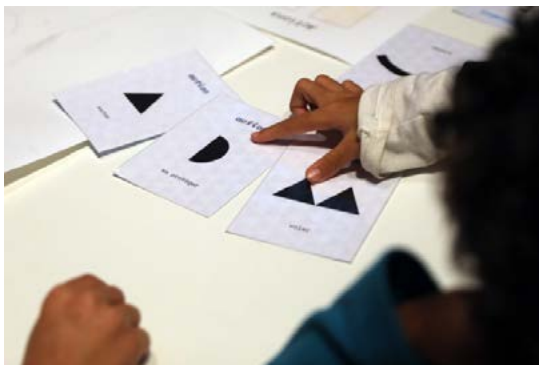
Atelier Design & Jeu vidéo

L'atelier est proposé en demi-groupe pour le confort des élèves. Prévoir de coupler votre déplacement avec une visite guidée d'exposition pour alterner les groupes.