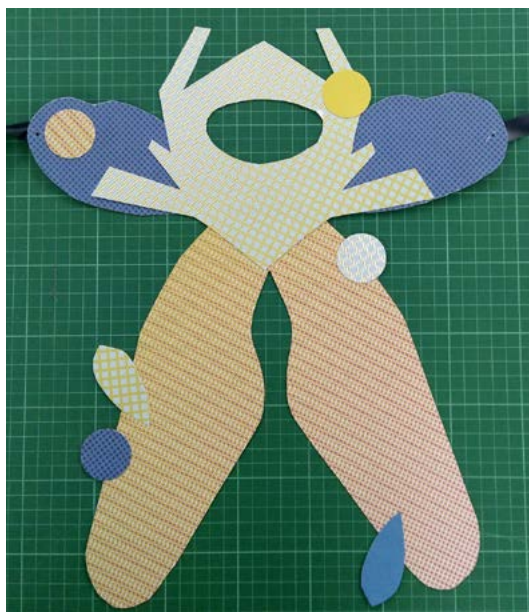
Atelier Design & Jardin