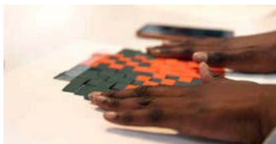
Atelier Design & Couleur