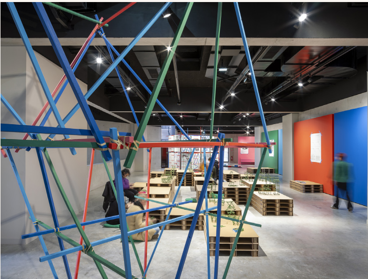
L'exposition-atelier Bâtons et élastiques au Signe - Centre national du graphisme à Chaumont, 2025

En donnant aux visiteurs la possibilité de s'asseoir, l'expérience d'exposition proposée ici se veut autre, plus immersive et contemplative, proposant un temps de regard prolongé sur les pièces. Ce temps favorisera ainsi une autre forme de réception, en accordant une attention particulière au dialogue qui s'engage entre espace et matière, statisme et mouvement, ombre et lumière, son et silence.