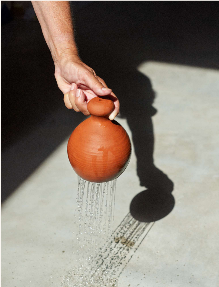
La chantepleure, arrosoir médiéval

➔ Catalogue des Objets trouvés - Commissaire et scénographe : Stefania Di Petrillo