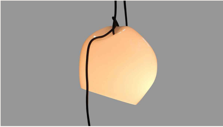
David Dubois, luminaire mobile, 2014, verre. réalisé en résidence au CIRVA © David Dubois photo O. Lebrun.

David Dubois est à la croisée de pratiques, nourrissant des liens avec le design, l'art contemporain, la mode ou la danse... Son parcours éclaire cette constante, celle d'affirmer une liberté de production et un goût de la transversalité.