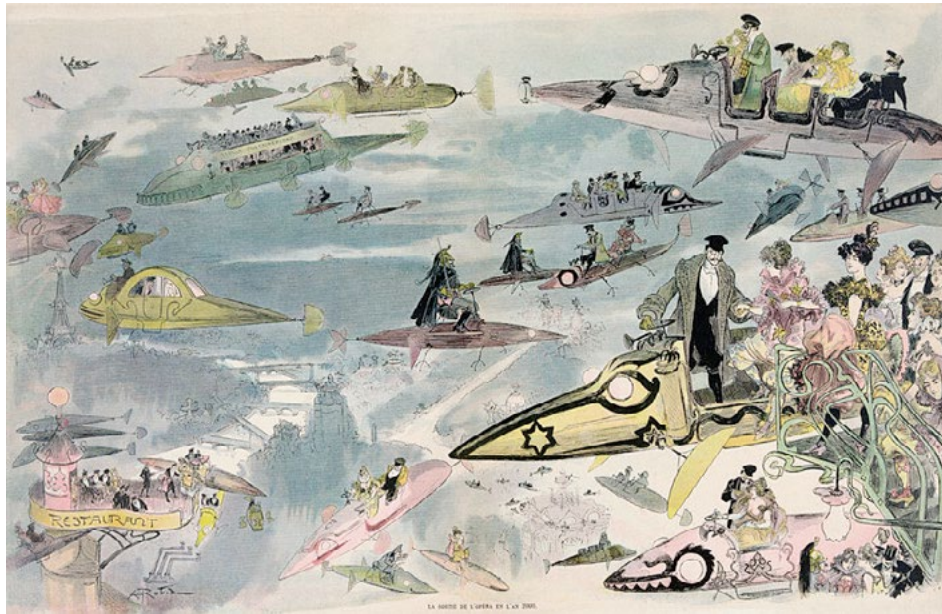
Sortie de l'opéra en l'an 2000, Albert Robida, 1902, gravure