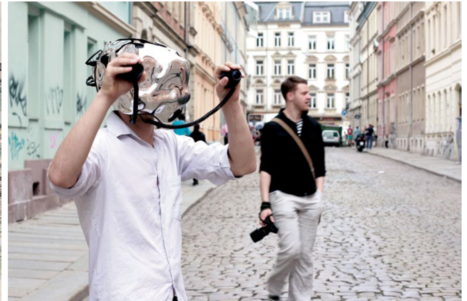
Eyesect by the constitute man standing eyes in hands, 2014