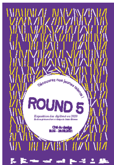
© Charlotte Goffette et Alice Koté

Plus d'informations sur : https://www.citedudesign.com/fr/a/round-5-1487