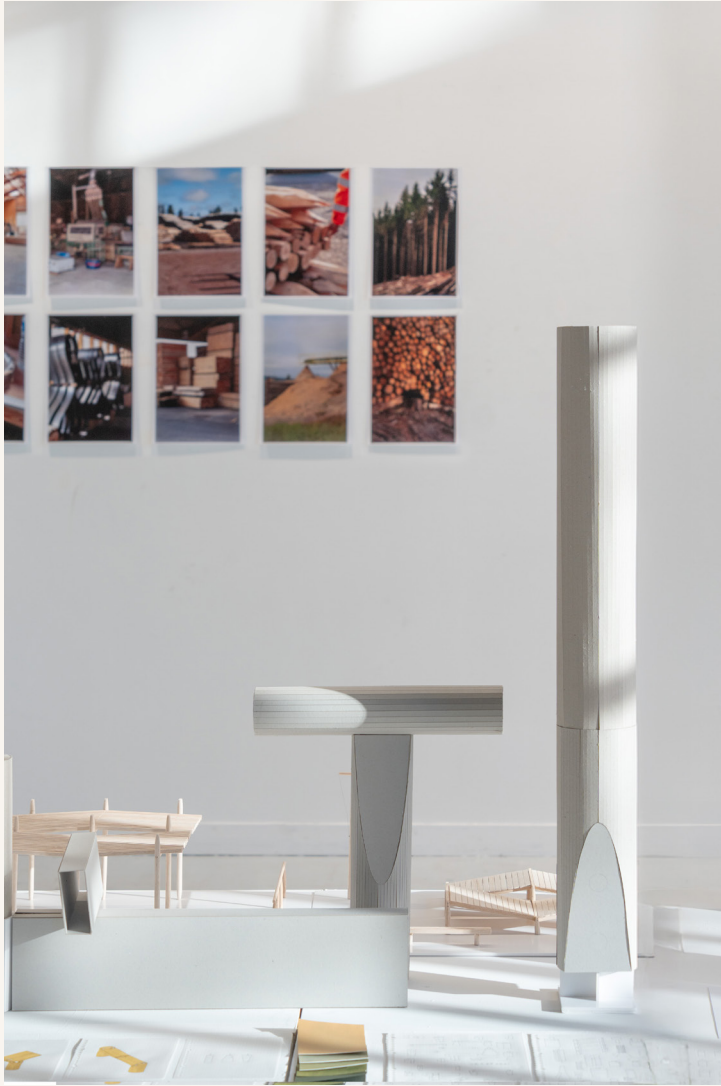
Recherche Local Tools