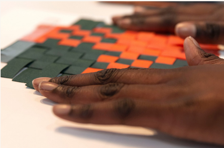
Atelier Design & Couleurs

Couleurs primaires ou secondaires, chaudes ou froides, qui nous plaisent beaucoup ou peu... la couleur est partout, pourtant elle n'existe pas en soi puisqu'elle n'est visible que dans la lumière. En design, la couleur est employée comme signifiant. Elle transmet des messages, des idées... Venez découvrir les couleurs et ses mélanges et composer un tissage coloré.