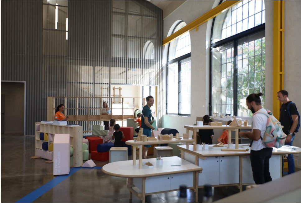
La Cabane © Cité du design

Mais que se passe-t-il dans la tête d'un designer ? Que fait-il ? Comment le fait-il ? Pourquoi ? Et pour qui ?