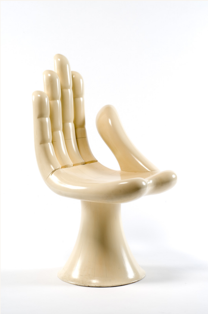
Pedro Friedeberg, Chaise , 1961, FNAC 1954, Collection du Centre national des arts plastiques © droits réservés/Cnap, Crédit photo : Béatrice Hatala / Les Arts Décoratifs

La Galerie nationale du design ouvrira ses portes à Saint-Étienne le 10 juin 2026, au cœur du quartier Cité du design.