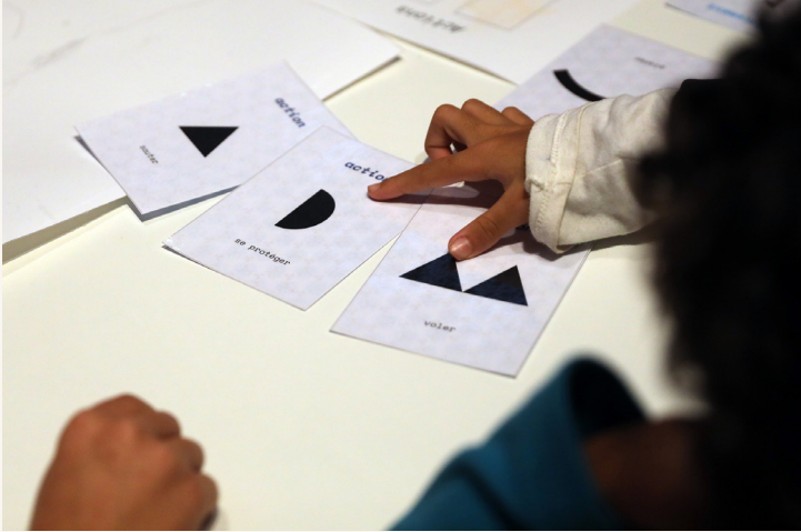
Atelier Design & Jeu vidéo

Le processus de conception d'un jeu vidéo, de la première idée à la phase test, comprend plusieurs étapes. Un avatar, un environnement, une quête et un peu de power-up , l'atelier Design et jeu vidéo guide les élèves dans les pas des game designers pour découvrir et comprendre le fonctionnement de création des jeux vidéo. Il s'agit d'appréhender et concevoir les mécanismes ludiques qui rendent un jeu captivant, innovant et entraînant. En équipe, les élèves conçoivent par le jeu, le dessin et l'imaginaire un prototype de jeu vidéo parfaitement jouable.