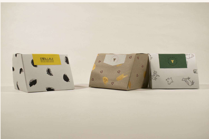
Atelier Design & Packaging

Interface entre le produit et son utilisateur, le packaging, qu'il soit pour un produit de grande consommation courante ou de luxe, remplit de nombreuses fonctions et nécessite pour le designer, de savoir manipuler de nombreux paramètres. L'animation Design & Packaging propose de sensibiliser le public aux questions de graphisme, d'identité visuelle, de couleurs à travers une sélection d'emballages et la réalisation d'un packaging d'après un cahier des charges.