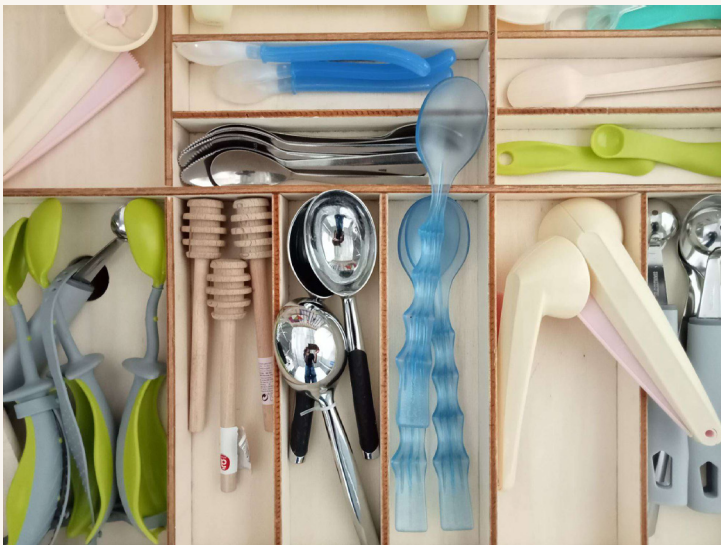
Atelier Design & Objet

Les élèves sont invités dans cet atelier à approcher et mieux comprendre le design d'objet à travers une sélection de cuillères (à café, à soupe, à glace, à salade...). Sur le mode du jeu, les élèves sont amenés à se mettre dans la peau d'un archéologue, d'un sociologue, d'un designer, en passant de l'observation à la conception selon un cahier des charges.