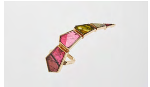
Bague Ferret articulée, or jaune et tourmaline, collection privée

Ohan Tuhdarian , dit Jean Vendome, brutalise les codes de la joaillerie par la création de bijoux asymétriques aux formes abstraites et le sertissage de gemmes non précieuses.