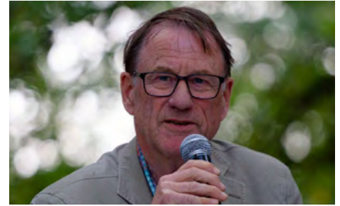
Tim Ingold © D.R