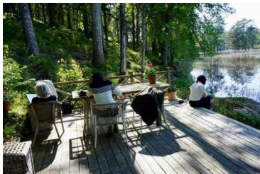
Séance de dessin au bord du lac / Drawing session at the lakeshore, IDE TO SÖRMLAND (SWEDEN), 2024