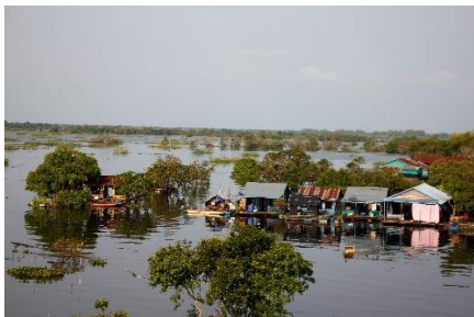
Villages flottants, Tonlé Sap, Cambodge / Floating villages, Tonlé Sap, Cambodia, IDE TO CAMBODIA, 2022