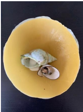
Workshop Iode et Pollen, ateliers du faire, Fondation Martell / Iodine and Pollen Workshop, ateliers du faire, Fondation Martell, IDE TO COGNAC (FRANCE), 2020