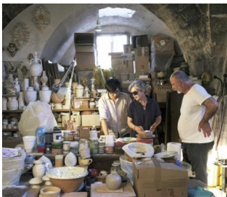
Séance de travail, Bottega Vestita, Grottaglie / Working session, Bottega Vestita, Grottaglie, IDE TO PUGLIA (ITALY), 2019