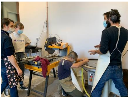
Séance de travail, ateliers du faire, fondation Martell / Working session, ateliers du faire, Fondation Martell, IDE TO COGNAC (FRANCE), 2020