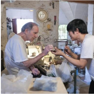
Séance de travail, Bottega Vestita, Grottaglie / Working session, Bottega Vestita, Grottaglie, IDE TO PUGLIA (ITALY), 2019