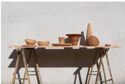
Workshop École Camondo, Terra Rossa, IDE TO SALERNES (FRANCE), 2023 © IDE