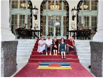
Équipe IDE, Hotel Le Royal Raffles Phnom Penh / IDE team at Le Royal Raffles Phnom Penh IDE TO Cambodia, 2022