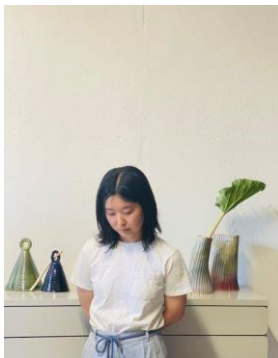
Mio Hatakenaka (designer), IDE TO SÖRMLAND (SWEDEN), 2024 © IDE