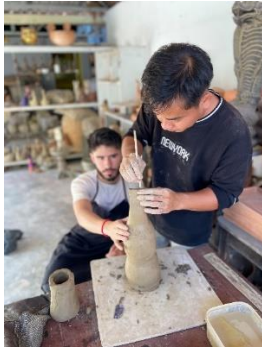
Séance de travail, Morodok, Siem Reap, Cambodge / Working session, Morodok, Siem Reap, Cambodia, IDE TO CAMBODIA, 2022