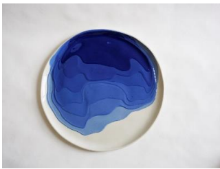
Blue Ressac , Goliath Dyèvre, IDE TO POLAND © IDE