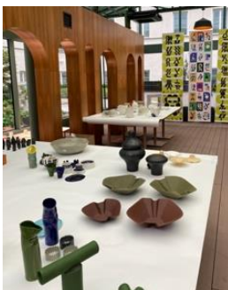
Pièces tout juste sorties du four, hôtel Raffles Europejski, Varsovie / "Just out of the oven" at Raffles Europejski, Warsaw, IDE TO POLAND, 2021