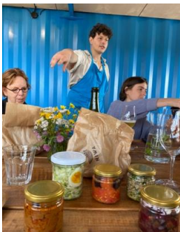
Déjeuner en Mazurie, Pologne / Lunch in Mazury, Poland, IDE TO POLAND, 2021