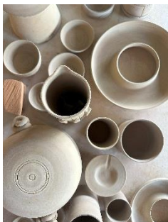
Atelier Morodok, Siem Reap, Cambodge / At Morodok, Siem Reap, Cambodia, IDE TO CAMBODIA, 2022