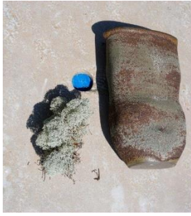
Vase avec émail « lichen », Emmanuelle Roule (designer) et Anna Lindell (céramiste) / Vase with “lichen” enamel, Emmanuelle Roule (designer) and Anna Lindell (ceramist), IDE TO SÖRMLAND (SWEDEN), 2024