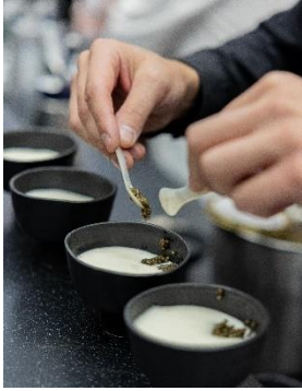
Démonstration culinaire par Marc Bretillot / Food tail by Marc Marc Bretillot, IDE TO POLAND, 2021