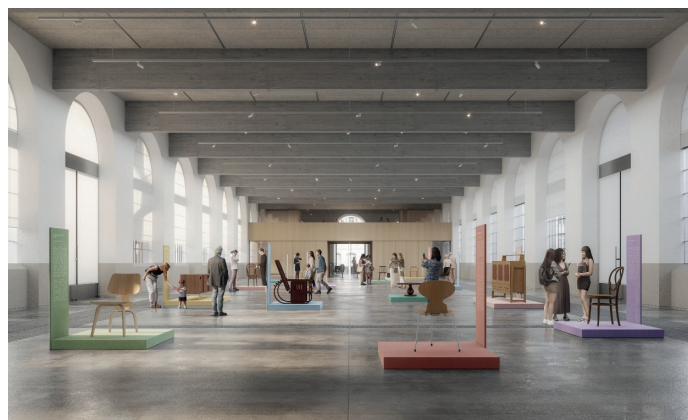
Galerie nationale du design, salle d'exposition © Saint-Étienne Métropole, SILT architectes, Piotr Banak

Hybrider les grandes collections nationales de design et les faire découvrir au plus grand nombre : c'est la mission de la Galerie nationale du design, qui ouvrira ses portes en juin 2026. Co-porté par l'EPCC Cité du design-Ésad Saint-Étienne et le Musée d'art moderne et contemporain de Saint-Étienne Métropole (MAMC+), ce projet se construit en partenariat avec des institutions culturelles majeures : Centre national des arts plastiques, Musée national d'art moderne-Centre Pompidou, Musée des arts décoratifs et du design de Bordeaux, Frac Grand Large-Hauts-de-France. Des commissaires invités concevront tour à tour une exposition annuelle racontant et questionnant le design sous ses multiples facettes en croisant l'ensemble de ces collections. Design en main , l'exposition inaugurale signée de Laurence Mauderli, mettra également en valeur les collections du Musée des Arts décoratifs (Paris), du Mobilier national et du Musée de la ville de Saint-Quentin-en-Yvelines.