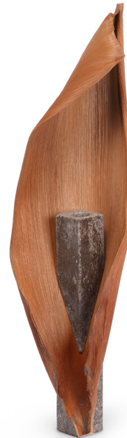
dach&zephir, Kòs, 2024, de la série « Vases Peyi* ». Pierre de lave, cosse de palmier royal et inox. 52,2 x 43,5 x 23,5 cm. Collection du Centre national des arts plastiques.

Avec les Vases Péyi, le duo de designers dach&zephir développe une réflexion ancrée dans les paysages et les cultures créoles. Leur recherche s'appuie sur une enquête historique autour de la présence du vase aux Antilles, révélant son statut marginal et importé. Florian Dach et Dimitri Zephir imaginent alors des formes adaptées aux fleurs tropicales, plus larges et ouvertes, affirmant une autre manière de composer les bouquets. Conçus à partir de matières végétales - feuilles de bananier, cosse de palmier - ces vases racontent la « bricolage » qu'on retrouve dans certains objets aux Antilles et participe d'une vision élogieuse du reste : les designers transforment le déchet végétal en un écrin protecteur pour les fleurs. Les vases deviennent des objets de récit, porteurs d'une mémoire collective et d'une vision décoloniale du design.