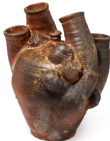
Île/Mer/Froid et Hervé Rousseau, Potts , 2024. Grès brut et kaolin. 56 × 45 × 38,5 cm. Collection du Centre national des arts plastiques. © Île/Mer/Froid et Hervé Rousseau / Cnap. Crédit photo : Fabrice Lindor

Le duo Île/Mer/Froid s'associe au potier Hervé Rousseau pour concevoir des vases ancrés dans une pratique collective et vernaculaire du territoire de La borne (Cher), haut lieu de la tradition potière. Les pièces sont ensuite déformées, assemblées et travaillées à plusieurs mains, donnant naissance à des formes hybrides, presque organiques. Après un long séchage, les vases sont cuits dans un four à flamme couchée inspiré des fours japonais, qui nécessite une organisation collective quasi rituelle durant plusieurs jours et plusieurs nuits pour assurer son fonctionnement. Le projet célèbre le « faire ensemble » et rend hommage aux gestes ancestraux de la poterie.