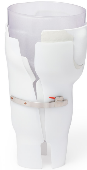
Heim+Viladrich, VASE_PROTEOR_485min_11/2024, 2024, de la série « VASE_NOM ». P.E.T.G., cuir et métal. 43 x 27 x 25 cm. Collection du Centre national des arts plastiques. © Heim+Viladrich/ Cnap.

En réponse à la commande "Créer un vase", Heim+Viladrich abordent l'objet sous l'angle de la technicité industrielle. Leur recherche s'ancre dans l'observation des procédés de fabrication contemporains et trouve un terrain privilégié chez PROTEOR, entreprise spécialisée dans la fabrication de prothèses. Refusant toute forme préconçue, les designers laissent émerger le vase à partir des protocoles, des outils et des gestes de l'industrie. Le projet naît d'un scan de prothèse de jambe, puis se matérialise par un assemblage de coques aux surfaces blanches, rendant visibles les strates de matériaux. Le volume final, vertical et creux, évoque à la fois le vase et l'objet médical, soulignant l'importance des dimensions techniques, humaines et collaboratives dans le processus de création.