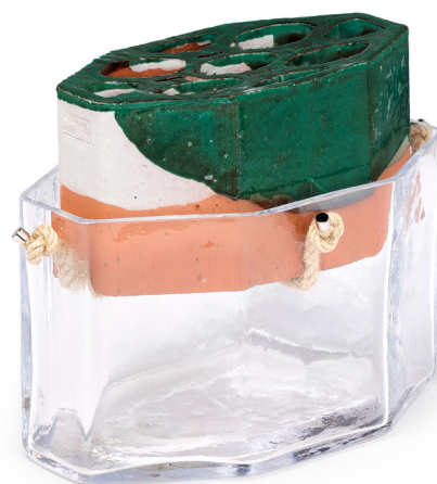
Jules Levasseur, Combinaisons n°1 , 2024. Terre cuite émaillée, verre soufflé et corde en chanvre. 29,5 × 23 cm. Collection du Centre national des arts plastiques © Jules Levasseur / Cnap. Crédit photo : Fabrice Lindor

Avec les deux modèles de vases Combinaisons , Jules Levasseur confronte le verre soufflé et la brique, associant artisanat verrier et savoir-faire industriel. Inspiré par une visite de tuilerie proche de son atelier, le designer développe une recherche nourrie par l'observation de fleurs sauvages poussant entre les palettes de briques. Le motif alvéolaire, emprunté aux ruches, structure les formes et évoque le cycle entre terre, fleur et pollinisateur. En utilisant la brique comme matrice, Jules Levasseur confère à ce matériau ouvrier une dimension symbolique et poétique. L'émaillage partiel transforme la surface en paysage stratifié, que les fleurs viennent prolonger. Les vases deviennent un objet narratif, à la croisée des cycles naturels, des gestes humains et des matières.