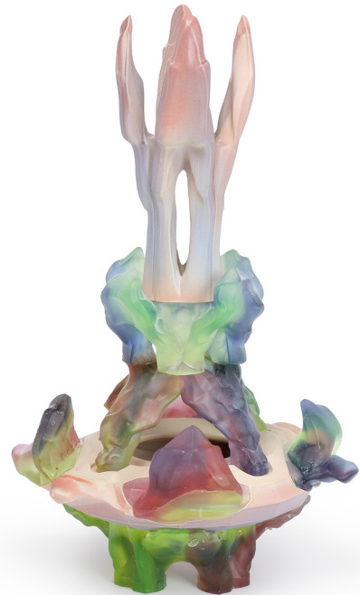
Octave Rimbert-Rivière, Vase à distorsion numérique , 2024. Grès émaillé et verre moulé. 55,5 × 33,5 cm. Collection du Centre national des arts plastiques © Octave Rimbert-Rivière / Cnap.

Avec le Vase à distorsion numérique , Octave Rimbert-Rivière développe une démarche à la croisée des technologies numériques et des savoir-faire artisanaux. L'ordinateur devient pour lui un véritable outil de création, capable de générer des déformations impossibles à produire manuellement. À partir de formes géométriques soumises à des modificateurs algorithmiques, il détourne l'archétype du vase et en altère la surface selon des variations imprévisibles. Inspiré par les tulipiers néerlandais du XVII e siècle, conçus pour accueillir plusieurs fleurs, il imagine un objet dont les ouvertures se déploient en réseau tentaculaire. La matérialisation du modèle virtuel constitue une étape essentielle du projet : confronté aux limites du verre moulé, le designer associe verre et céramique, assemblés pour former un vase hybride. L'objet final incarne une fusion entre univers numérique et matière, où la forme du bouquet devient structure même du vase.