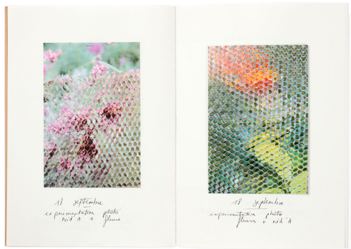
Jules Levasseur, étude, carnets (extraits), 2023. Papier découpé, collé, photographies, encre, crayons de couleur, crayons graphie et pastel, gras sur papier. Collection du Centre national des arts plastiques © Jules Levasseur / Cnap.

Présentés sous forme de prototypes ou d'objets uniques, les vases exposés incarnent des positions distinctes mais complémentaires. Ensemble, ils dessinent un panorama sensible du design contemporain, où l'objet familier devient le révélateur de pratiques ouvertes, critiques et engagées.