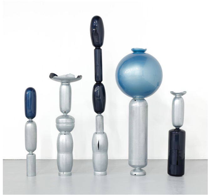
Marie et Alexandre, Vases acoustiques , 2024. Acier galvanisé et peinture de carrosserie. h : 95 cm ; 109 cm ; 169,5 cm ; 135 cm ; 90 cm. Collection du Centre national des arts plastiques. © Marie et Alexandre/ Cnap.

Pour "Créer un vase", le duo Marie et Alexandre explore une typologie méconnue : le vase acoustique. Inspirés par des dispositifs utilisés depuis l'Antiquité dans l'architecture des églises et des théâtres, ils s'appuient sur des recherches historiques et scientifiques pour en analyser les composantes. À partir de dessins et collages, ils imaginent des formes totémiques, réalisées en métal pour ses propriétés acoustiques. Le projet repose sur la récupération de pièces industrielles retravaillées et assemblées en collaboration avec des artisans. Découpes ou fentes viennent s'ajouter à la surface des vases afin qu'ils puissent accueillir et faire résonner une panoplie de sons. Par leur finition galvanisée et peinte, ces objets associent acoustique, recyclage et esthétique industrielle.