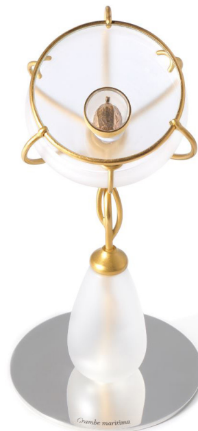
Gregory Granados, Crambe maritima , 2024, de la série « Vases pour une graine ». Argent massif, vermeil, verre soufflé, graine de Crambe maritima dorée et lentille de verre. 22,5 x 10,5 cm. Collection du Centre national des arts plastiques. © Gregory Granados / Cnap.

Avec la série Vase pour une graine , Grégory Granados interroge la fonction paradoxale du vase en revenant à l'origine du végétal. En choisissant la graine de Crambe maritima , espèce côtière menacée, le designer conçoit un objet à l'échelle de l'infiniment petit. Associant recherche botanique, microscopie électronique, verrerie scientifique et orfèvrerie, il imagine un objet où la graine est sertie comme une pierre précieuse. Un pied en verre se déploie en ramifications, soutenant une coupole qui accueille la graine dorée, révélée par une lentille optique. À la fois observatoire scientifique et écrin de conservation, le vase devient un outil de contemplation et de préservation du vivant, invitant à porter attention à ce qui est habituellement invisible.