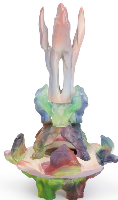
Octave Rimbart-Rivière, Vase à distorsion numérique , 2024. Grès émaillé et verre moulé. 55,5 × 33,5 cm. Collection du Centre national des arts plastiques © Octave Rimbart-Rivière / Cnap. Crédit photo : Fabrice Lindor

Avec le Vase à distorsion numérique , Octave Rimbart-Rivière développe une démarche à la croisée des technologies numériques et des savoir-faire artisanaux. L'ordinateur devient pour lui un véritable outil de création, capable de générer des déformations impossibles à produire manuellement. À partir de formes géométriques soumises à des modificateurs algorithmiques, il détourne l'archétype du vase et en altère la surface selon des variations imprévisibles. Inspiré par les tulipiers néerlandais du XVII e siècle, conçus pour accueillir plusieurs fleurs, il imagine un objet dont les ouvertures se déploient en réseau tentaculaire. La matérialisation du modèle virtuel constitue une étape essentielle du projet : confronté aux limites du verre moulé, le designer associe verre et céramique, assemblés pour former un vase hybride. L'objet final incarne une fusion entre univers numérique et matière, où la forme du bouquet devient structure même du vase.