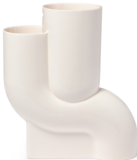
Jacques Avena, Vase sanitaire , 2024. Faïence émaillée, 49 x 44,5 x 17 cm. Collection du Centre national des arts plastiques © Jacques Avena/ Cnap.

Pour la commande "Créer un vase", Jacques Avena rend hommage aux savoir-faire liés à la maîtrise de l'eau domestique en France. Nourrie par son expérience au sein de l'entreprise Jacob Delafon, aujourd'hui délocalisée, sa démarche convoque la mémoire ouvrière et industrielle de la fabrication sanitaire. Ainsi, le Vase Sanitaire puise dans la grammaire formelle et technique d'un élément de l'usine : de sa silhouette issue de l'assemblage de ces différentes parties, à ses proportions, sa matérialité, jusqu'à l'intégration d'un trop-plein. C'est l'emprunt direct à ces formes industrielles spécifiques qui lui donne son identité et sa valeur militante.