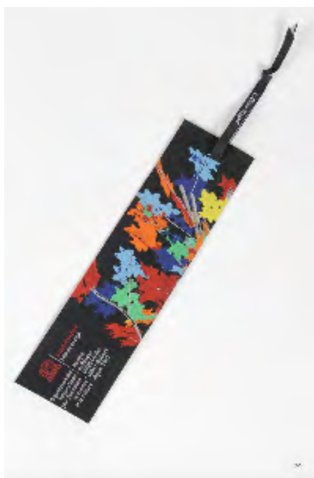
Neyret Rubans Marque-page tissé Jacquard 50 pièces - Prix d'achat 10,05 TTC