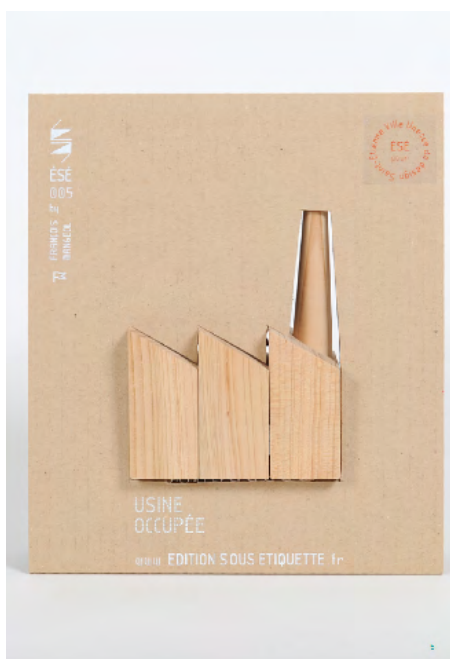
Édition sous étiquette Usine occupée Prix d'achat 33,97 HT