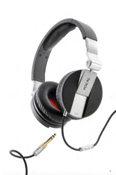
Focal Casque Spirit one Prix d'achat 166,39 HT