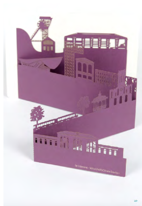
Audrey Malfatti Panorama de Saint-Etienne Prix d'achat 8,32 HT