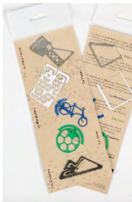
Audrey Dodo et Franck Dardé Marques pages Pack de 5 - Prix d'achat 13,95 TTC